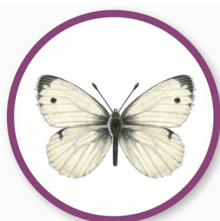
PIÉRIDE DU CHOU

Pour observer les papillons, rien de plus simple: vous enduisez un arbre de confiture et vous attendez que les papillons s'y déposent. Une paire de jumelles vous aidera même à les voir alors de très près!