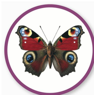
PAON DE JOUR