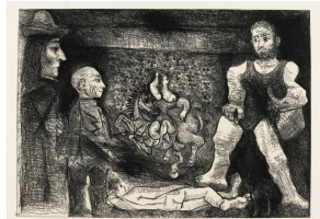
AUTOUR DU CHEF-D'ŒUVRE INCONNU peintre modèle, couple et deux peintres, 1968, eau-forte sur cuivre. Epreuve sur papier vélin de Rives.