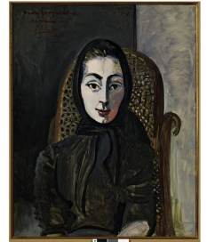
JACQUELINE ASSISE AVEC SON CHAT 1964 Huile sur toile Collection particulière