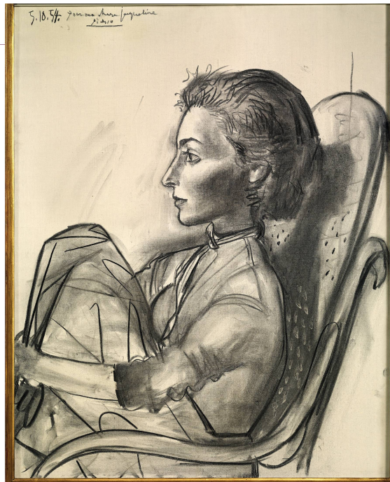
JACQUELINE AUX JAMBES REPLIÉES Fusain et préparation sur toile, 1954 Collection particulière