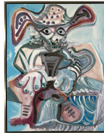
HOMME AU CHAPEAU ASSIS 1972 Huile sur toile 145,5 x 114 cm Museum Frieder Burda, Baden-Baden