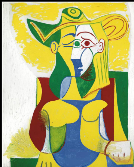
Pablo Picasso, Jacqueline assise avec un parapluie vert et jaune, 1962, h/v, 162 x 130 cm. Collection particulière, © Succession Picasso / 2016, Prodlers, Zürich / Photo Claude Germain