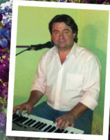
Animation par ROCCO musicien et chanteur