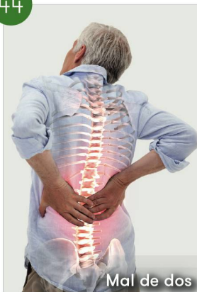
Mal de dos