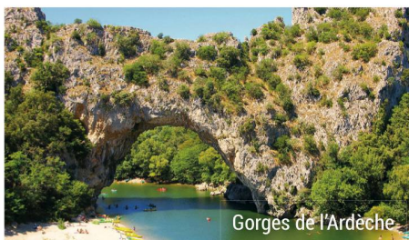
Gorges de l'Ardèche

Pension complète à bord. Navigation vers Avignon. Excursion classique facultative: visite guidée de la Cité des Papes , véritable citadelle sise sur un piton de roc et complétée par une ceinture de remparts. Croisière vers Roquemaure. Visite facultative des gorges de l'Ardèche , la célèbre route des gorges sillonnée par les nombreux belvédères. Retour à bord à Saint-Étienne-des-Sorts. Départ vers Viviers.