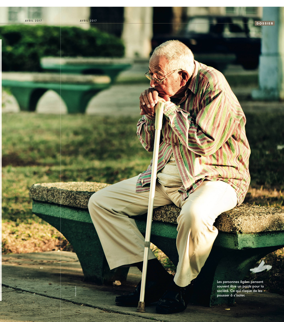
Les personnes âgées pensent souvent être un poids pour la société. Ce qui risque de les pousser à s'isoler.

Et c'est bien là tout le problème. La dépression chez la personne âgée n'est souvent pas reconnue ou mal diagnostiquée, car elle peut facilement être attribuée au processus de vieillissement et être masquée par des troubles somatiques : « On pense que c'est normal que l'aîné soit triste. Si la détection de la dépression peut être problématique à tout âge, quand la personne est âgée, d'autres symptômes, plus apparents, sont pris en compte et priment souvent. Les troubles de l'humeur sont moins identifiés et, quand ils le sont, souvent, ils ne sont >>>