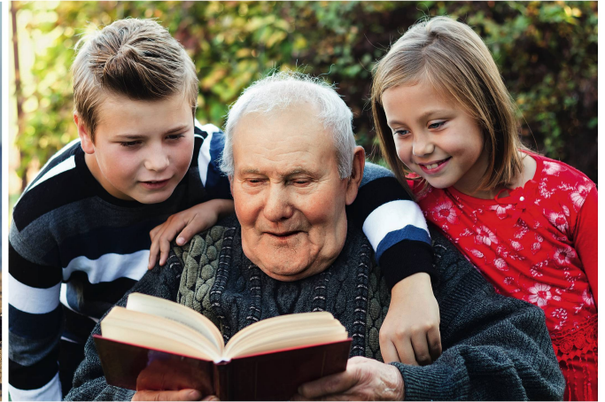
sociale font partie des mesures pour améliorer la qualité de vie des personnes âgées.

en Suisse de huit à dix ans pour les femmes et de six à sept ans pour les hommes.