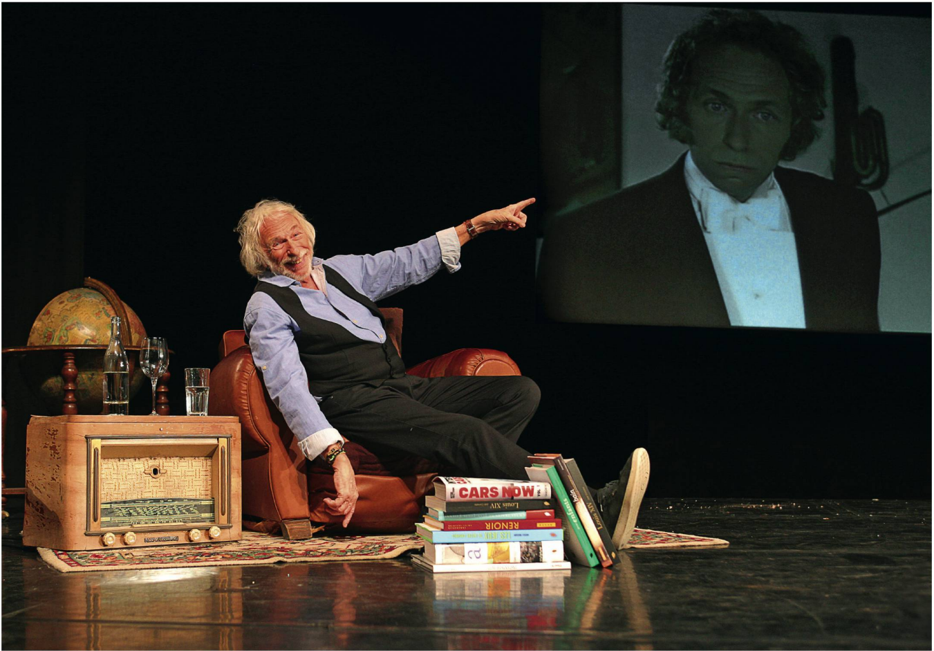
Pierre Richard fait partie des rares comédiens comiques à posséder le sens du burlesque. Ici dans son prochain spectacle Petit éloge de la nuit .

rentrer chez eux et disparaître derrière le porche. Les pensionnaires avaient, eux, un quart d'heure de récréation avant de se remettre à l'étude obligatoire. On mangeait peu et mal. Je me souviens que, le vendredi, ça sentait le poisson dans tout l'établissement, preuve qu'il n'était pas très frais. Il faisait froid dans les dortoirs. Comme les conditions de vie étaient dures, les élèves devenaient vite méchants et agressifs, d'où une ambiance tendue et peu favorable à la construction d'un adolescent.