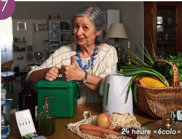
24 heure «écolo»