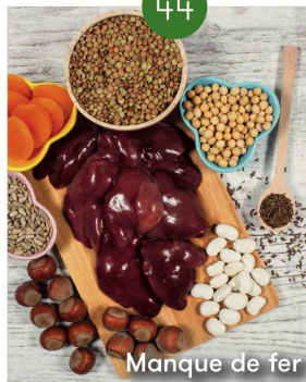
Manque de fer