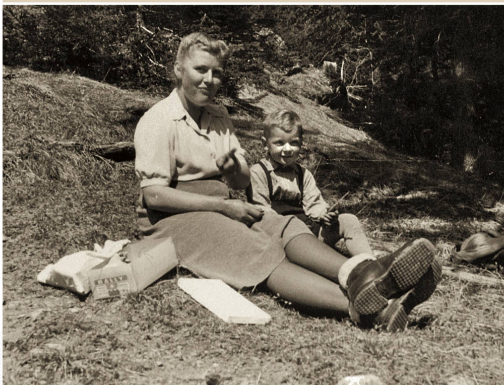
Musée de Sainte-Croix