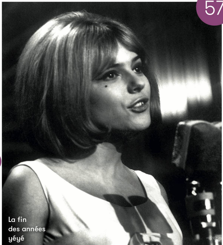
La fin des années yéyé