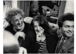
2001 Martha Argerich, Mischa Maisky et Evgeny Kissin. «Ma fierté: avoir pu réunir des monstres sacrés dans le même concert! Je connais Martha depuis 15 ans, une amie qui m'a toujours accompagné...»