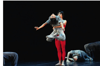
2011 Béjart. «Quelle troupe magnifique! J'adore. Quand tu rencontres Béjart, tu sens qu'il se passe quelque chose. Un grand homme, une gueule aussi.»