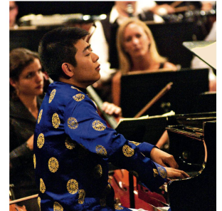
2003 Lang Lang. «Il est l'ego personifié, je l'avais signé alors qu'il était adolescent... Brillant ambassadeur de Chine, qui pourrait devenir ministre de Culture, un jour...»