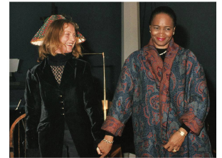
1994 Isabelle Huppert et Barbara Hendricks. «C'était notre premier concert de Noël, avec Barbara qui chantait. Isabelle est une amie intime qui venait skier chaque hiver, à Verbier, avec sa famille.»