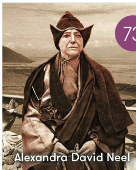
Alexandra David Neel