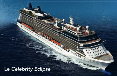
Le Celebrity Eclipse

Vous quitterez l'hôtel après le petit déjeuner et vous rejoindrez l'aéroport. Vous décollerez à destination de Genève sur un vol régulier avec escale.