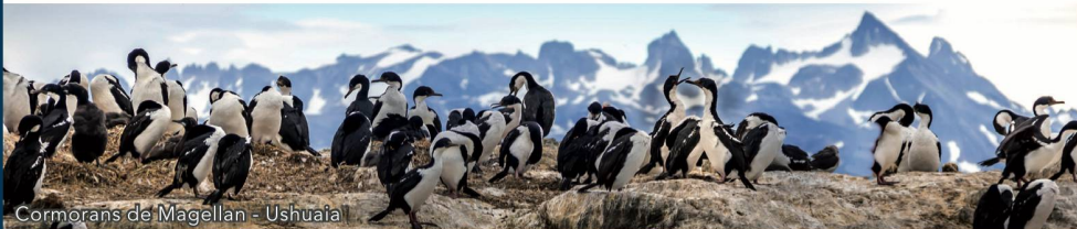
Cormorans de Magellan - Ushuaia

Le pré et post-acheminement de votre résidence jusqu'à Genève | Les excursions, sauf les visites de Valparaíso et de Santiago le jour du débarquement | Les boissons | Les dépenses personnelles à bord ou lors des excursions | L'assurance rapatriement, annulation et bagages | Les pourboires d'usage aux guides au cours des excursions.