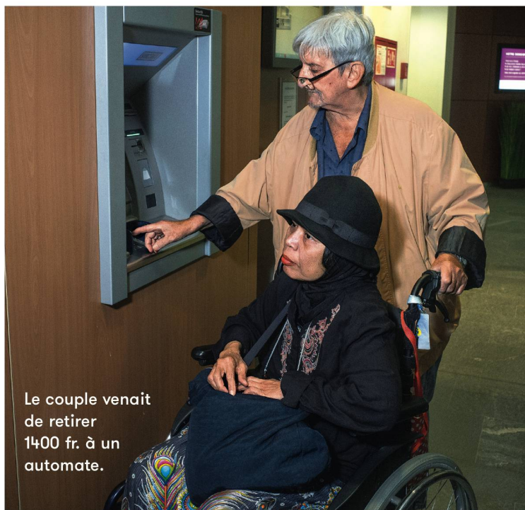
Le couple venait de retirer 1400 fr. à un automate.

son salon : Jacques Mayol, Jacques Cousteau, Brigitte Bardot. Avant de nous quitter, il évoque ses origines corses qui sont peut-être pour quelque chose dans son acharnement têtue à exiger réparation.