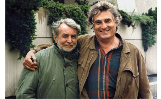
Été 1996.