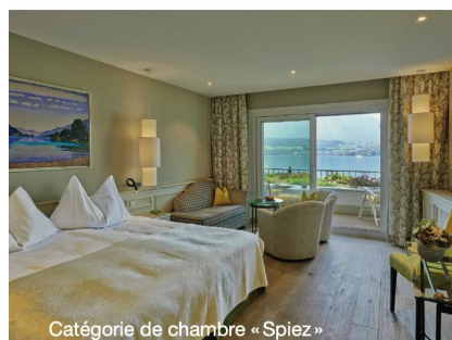
Catégorie de chambre « Spiez »

Mais la meilleure solution, vous la connaissez ! Pourvu que l'on s'en serve, la fonction qui nous permet d'introduire dans nos téléphones les noms et les numéros de nos connaissances, est prodigieusement utile : si c'est le nom d'un ami ou d'un proche qui s'affiche, je décroche au quart de tour. Si, au contraire, s'affiche la mention « Appel externe » ou « Inconnu », je m'écarte du combiné comme d'un serpent à sonnettes. L'inconnu laissera un message si c'est important. Mon seul problème désormais est celui-ci. Sitôt que le téléphone sonne, je cours pour voir ce qui est écrit sur l'écran. Hélas, parfois, je n'ai pas mes lunettes sur le nez. Impossible de lire ! Bon sang, est-ce un ami ou un inconnu ? Je galope dans tout l'appartement à la recherche de mes lunettes et, ça, c'est comme de chercher des œufs de Pâques. Je perdais sept secondes à répondre aux appels importuns, je perds parfois quinze minutes à retrouver mes lunettes. Mes chers, je sens que, en ce début d'année 2019, je vais au devant de difficultés inextricables.