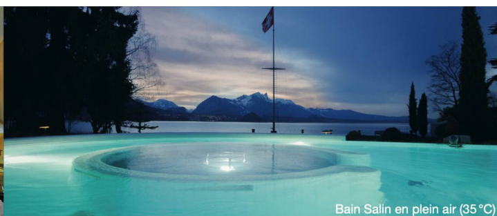
Bain Salin en plein air (35 °C)