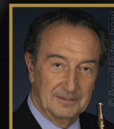
Maxence Larrieu Flûtiste