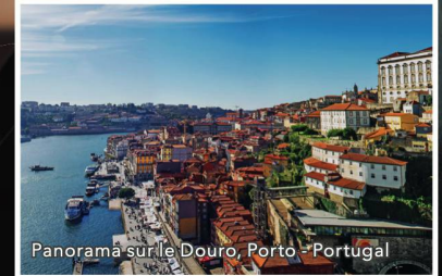
Panorama sur le Douro, Porto - Portugal

Le Douro, depuis Porto Du 11 au 18 octobre 2019