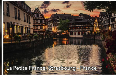
La Petite France, Strasbourg - France

Le Rhin, de Strasbourg à Coblenz Du 11 au 17 septembre 2019