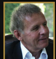
Patrick Poivre d'Arvor Invité exceptionnel

En partenariat avec Bliithner THE GOLDEN TONE