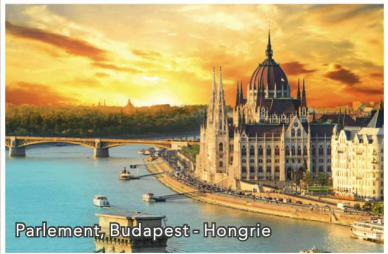
Parlement, Budapest - Hongrie

Le Danube, de Vienne jusqu'à la mer Noire Du 8 au 19 juin 2019