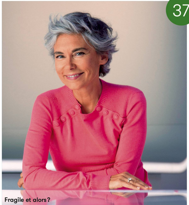
Fragile et alors?