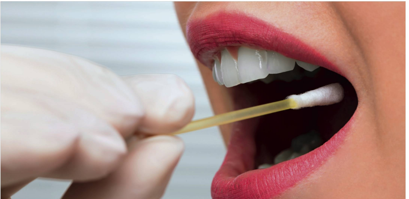
L'une des deux méthodes pour recueillir son ADN : un simple bâtonnet qu'on frotte sur l'intérieur de la joue.

Abordables et faciles à réaliser, les tests ADN généalogiques connaissent un véritable engouement. Des millions de personnes de par le monde envoient leur salive à des laboratoires pour connaître leurs origines. A tort ou à raison ?