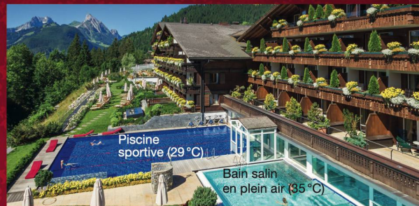
Piscine sportive (29 °C)