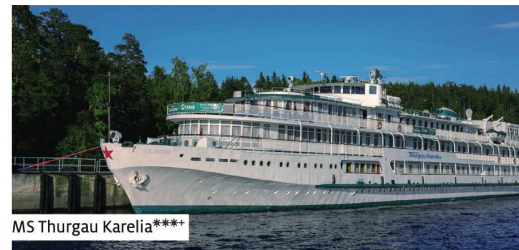
MS Thurgau Karelia****

Ce navire fraîchement rénové en 2018/2019 propose 71 cabines pour 142 passagers. Les cabines de catégorie Standard sur le pont principal (env. 10 mètres carrés) possèdent des hublots non ouvrable. Les cabines de catégorie Standard Plus sur le pont intermédiaire (env. 13,5 mètres carrés) ainsi que les cabines de catégorie Standard Plus sur le pont Panorama (env. 15 mètres carrés) ont une fenêtre pouvant s'ouvrir. Les cabines de catégorie Standard Plus sur le pont supérieur (env. 14 mètres carrés) sont agencées avec un balcon à la française. Les cabines de catégorie Supérieure à l'avant et à l'arrière du pont supérieur (env. 15 mètres carrés), les cabines de catégorie Supérieure sur le pont supérieur (environ 15,5 mètres carrés), les cabines de catégorie Supérieure Plus sur le pont supérieur et sur le pont Panorama (16 mètres carrés) ainsi que les Junior Suites sur le pont supérieur (environ 18 mètres carrés) ont un balcon privé. L'équipement de bord comporte deux restaurants, un salon spacieux sur le pont Panorama avec un bar et un fitness. Les passagers des cabines de catégorie Supérieure Plus et Junior Suite sur le pont supérieur ainsi que les passagers du pont Panorama prennent leurs repas au restaurant Onega, les autres au restaurant Ladoga sur le pont intermédiaire. Bateau non-fumeur , à l'exception de quelques zones mentionnées à bord.