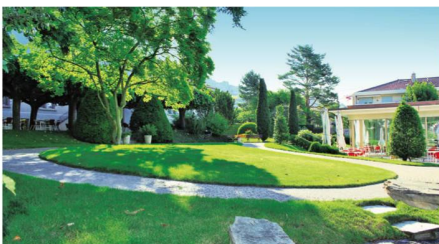
Les 3 bâtiments de l'établissement sont idéalement implantés au cœur d'un parc arborisé de 10'000 m 2 .