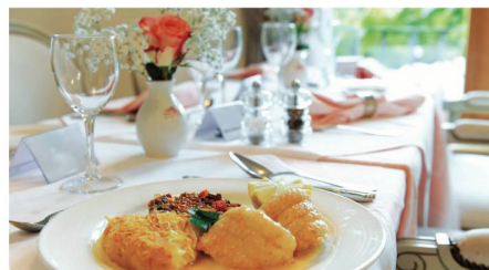
Une table et un service hôtelier de premier ordre.