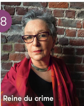
Reine du crime