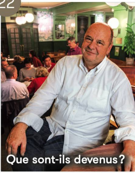
Que sont-ils devenus?