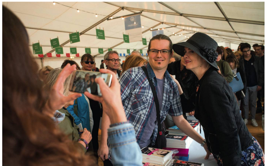
Amélie Nothomb adore rencontrer ses lecteurs. Comme ici, en 2017, à Livre sur les quais. Elle sera de nouveau à Morges cette année en tant que coprésidente de la manifestation.

Gagnez des places pour une rencontre et une séance de dédicaces avec Amélie Nothomb en page 88.