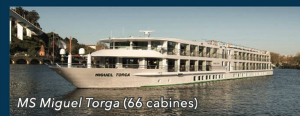
MS Miguel Torga (66 cabines)

Le pré et post acheminement de votre résidence à Genève | Les excursions | Les dépenses personnelles à bord et/ou pendant les excursions | Les assurances annulation/ bagages/ rapatriement.