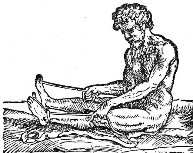
Abb. 1. Holzschnitt aus De Humani corporis fabrica libri septem von VESAL. Basel 1555 (2. Auflage). Illustration der Bedeutung des Band- und Fasziensystems für die Muskelfunktion des Großzehnstreckers. Die Idee dieser Abbildung ist wohl durch Galens Myologie angeregt