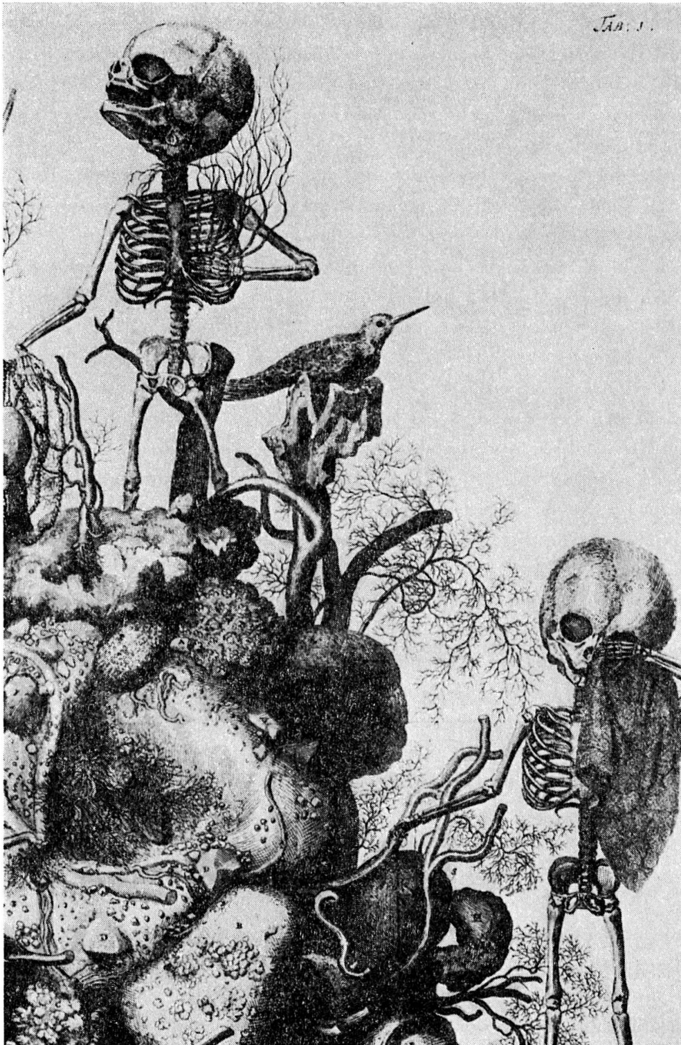
Abb. 1. Frederik Ruysch, Thesaurus anatomicus , Amsterdam 1701–1716, Thes. I, Tab. 1 (Ausschnitt). Kupferstich: 37,5 × 33 cm. Zeichner und Stecher: Cornelius Huyberts (1669/70–1712?)