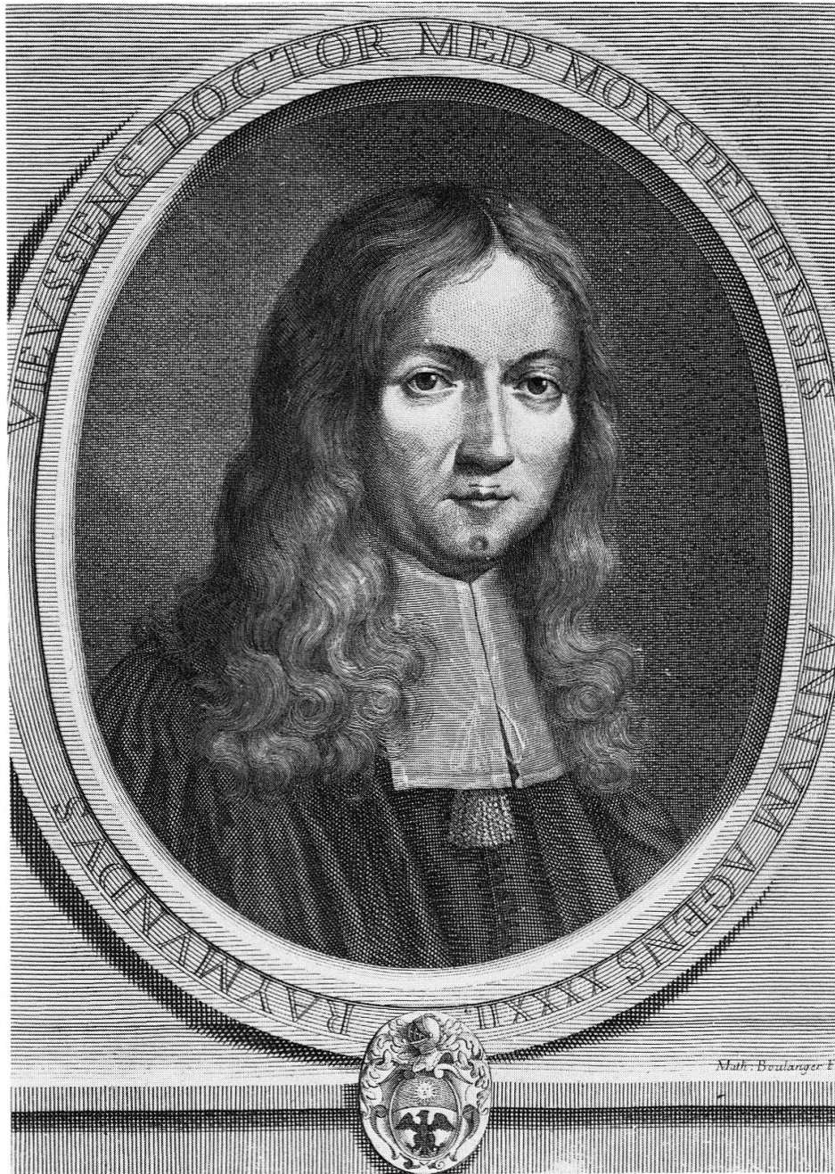
Abb. 5. Porträtstich des Raymund de Vieussens im Alter von 42 Jahren. Gestochen von Math. Boulanger. Vorsatzblatt der «Neurographia universalis», Editio altera, Lyon 1685

homine, praeter animam corpoream, qualem cum brutis communem habet, alia superioris mere spiritualis vestigia, plane detegimus ... – «Neben der Körperseele, die der Mensch mit dem Tiere teilt, haben wir klar die Spuren einer Geistseele gefunden.»