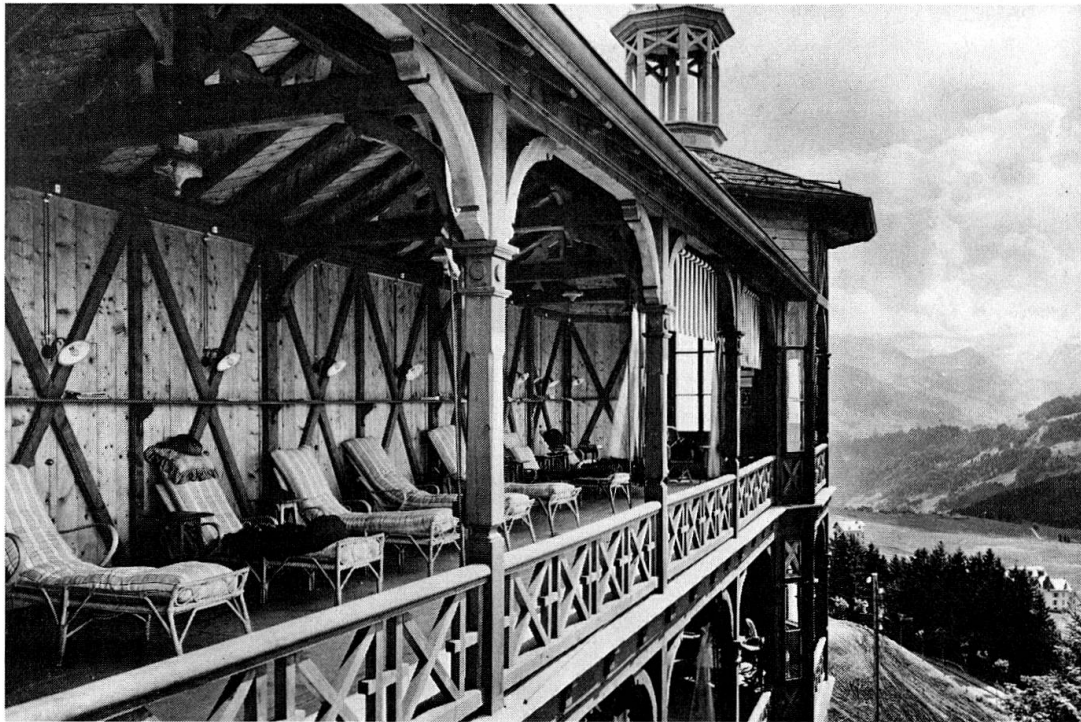
Fig.3 Galerie de cure du Sanatorium du Chamossaire construit en 1906 (aujourd'hui démoli). Quelques exemples remarquables de cette architecture sont conservés, parmi lesquels le Sanatorium du Grand Hôtel (1892, 1906) et Les Frênes (1909).

cure de travail, Rollier ayant lutté contre le désœuvrement parfois dramatique des malades.