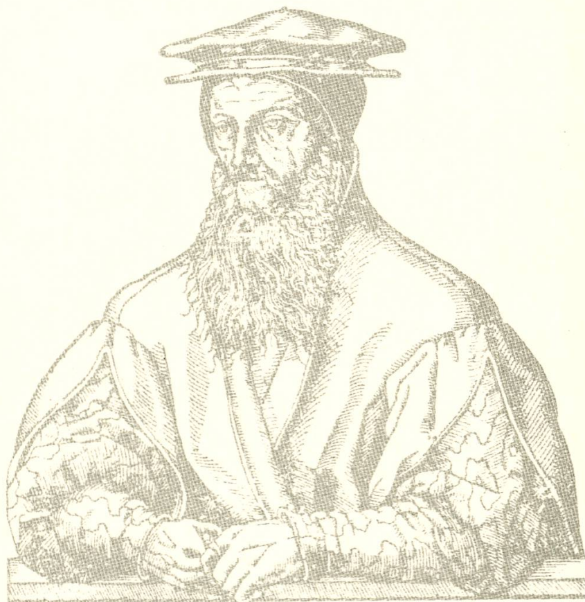
Conrad Gessner 1516–1565

Swiss Journal of the History of Medicine and Sciences Vol. 52 (1995) N° 3/4