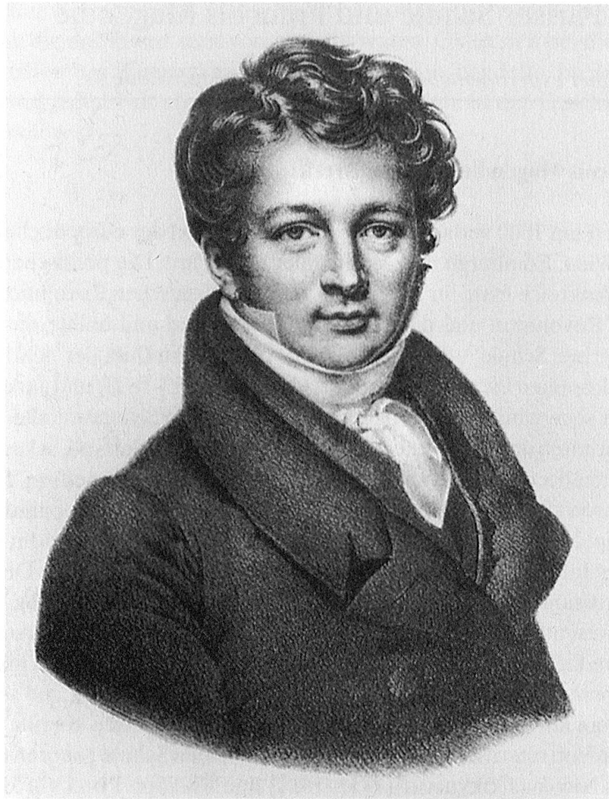
Abb. 1. François Magendie (1783–1855).