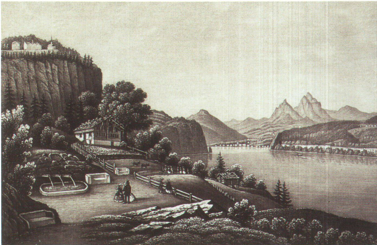
Abb. 2: In einer nächsten Phase wurden die Quellen offenbar so gestaltet, dass drei Fassungen die drei beteiligten Orte repräsentierten.