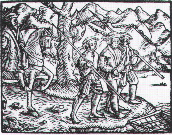
Urner Tellspiel. Gedruckte, erweiterte Fassung von 1545 mit älterer Holzschnittfolge der Tell- und Befreiungsgeschichte: Der gefangene Tell wird in Flüelen aufs Schiff gebracht.