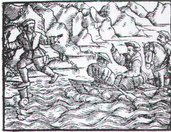
Urner Tellspiel. Gedruckte, erweiterte Fassung von 1545, mit älterer Holzschnittfolge der Tells- und Befreiungsgeschichte.