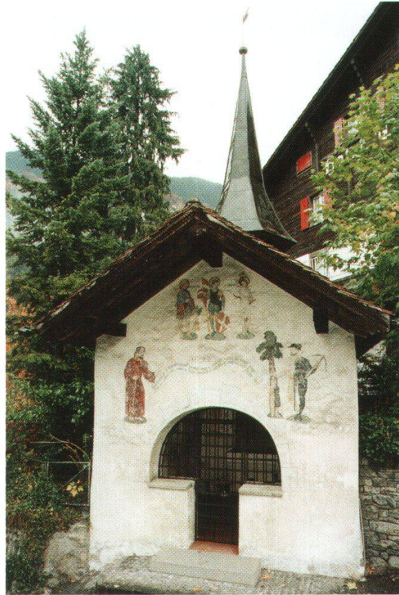
Tellskapelle in Bürglen. Erbaut 1582, ausgemalt 1588.

Im 16. Jahrhundert bestehen in Uri drei Tellskapellen: Im frühen 16. Jahrhundert entstand eine erste Kapelle auf der Tellsplatte. 1589/90 wurde dort ein Nachfolgebau erstellt. 1582 wurde die noch bestehende Kapelle in Bürglen erbaut. Bei allen drei Kapellen handelt es sich um geweihte Gotteshäuser, gelegentlich wurden Messen in ihnen gehalten, mit Sicherheit am Kapellenweihtag. Die drei Kapellen gedenken eines nichtkirchlichen, für die Allgemeinheit bedeutsamen Geschehens, welches mit ihrem Standort verbunden ist. Und eine andere, auffallende Gemeinsamkeit dieser Kapellen besteht darin, dass sie einen nichtkirchlichen Freskenzyklus enthalten, der zur besagten Stätte in Bezug steht.