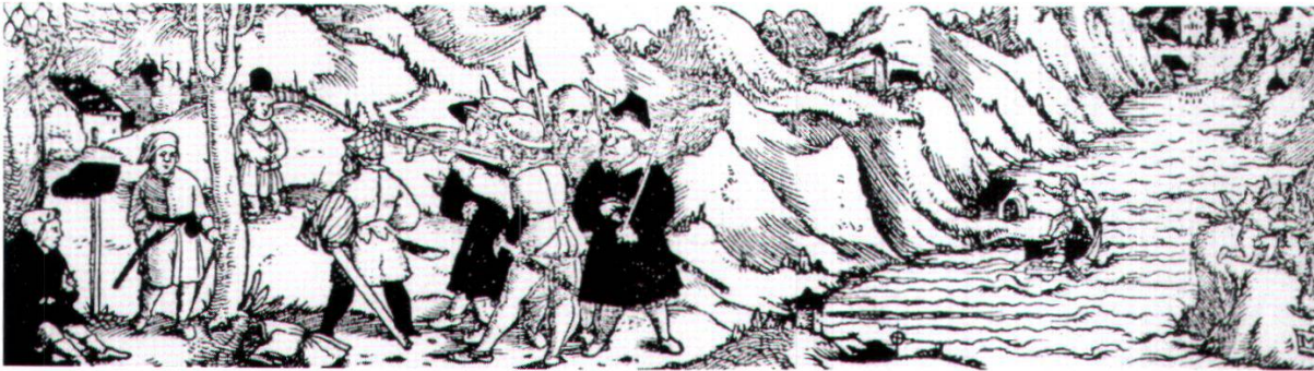
Erste Telskapelle am See. Mit Tellsprung. Holzschnitt um 1540.