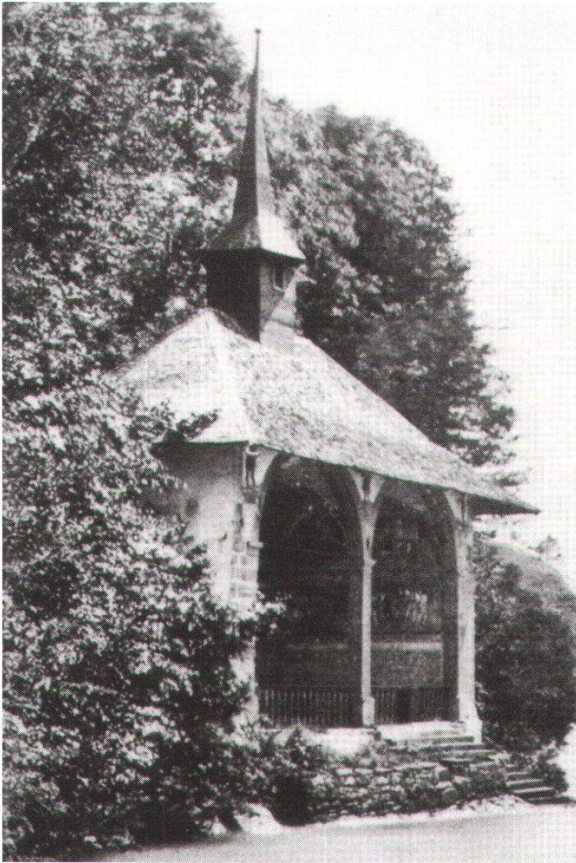
Zweite Tellskapelle am See, erbaut 1589/90. Foto um 1875, kurz vor ihrem Abbruch.