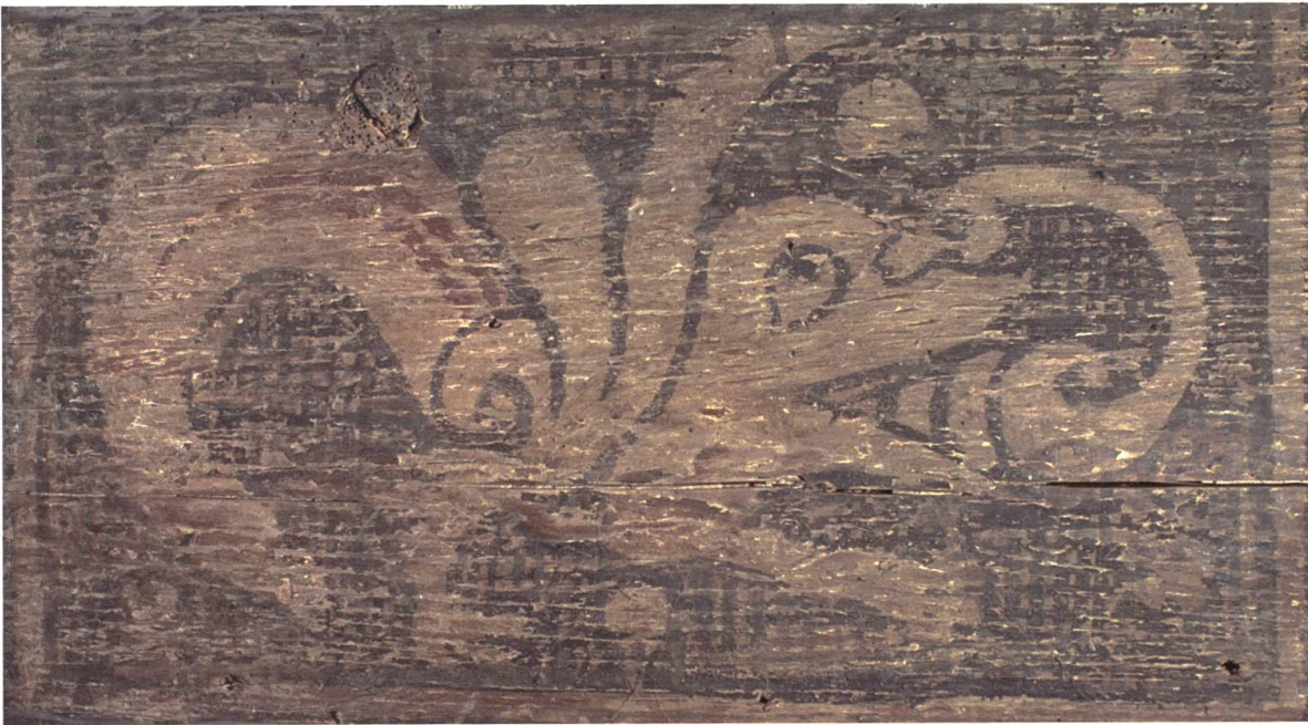
Amphisbaene (4-o-14). Bei der Amphisbaene im «Schönen Haus» sitzt der zweite Kopf auf dem gewundenen Hals, schnell aus dem Maul des Tieres hervor und beisst es in die Nase. Wie es der griechische Name verrät, ist die Amphisbaene imstande, vorwärts und rückwärts zu kriechen, was als doppelte Bosheit oder auch als Klugheit gedeutet wurde.