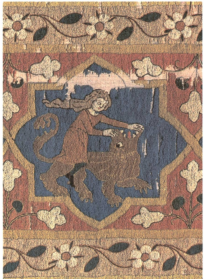
Abb. 85 Daneben kommt es auch zum Kampf zwischen Mensch und Tier (4-w-8).

Abb. 89 Ein stilistisch ähnlich ausgeführtes Motiv vom Kampf Samsons mit dem Löwen findet sich auf dem Malterer Teppich, wo Samson ebenfalls mit wehendem Haar und knielanger Bekleidung dem Löwen von hinten an den Rachen greift. Malterer Teppich, Augustinermuseum, Freiburg i. Br., Wollstickerei auf Leinen, 67,5 × 491 cm.