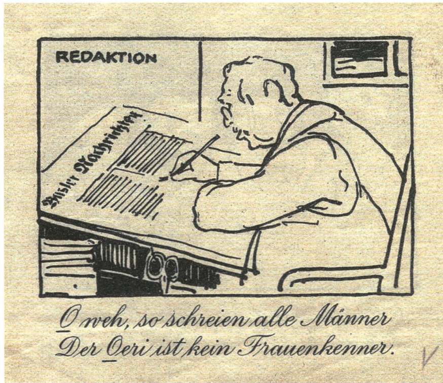
Buchstabe O aus dem Frauenstimmrechts- ABC