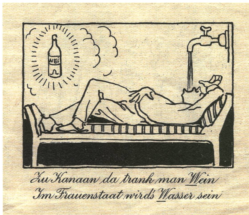
Buchstabe W aus dem Frauenstimmrechts- ABC

beschworen: Frau Eva verführte den Adam und brachte dem Mann den Verlust des Paradieses ein. Es gilt als ontologisch feststehende Gewissheit: Die Frau ist schwatzhaft und streitlustig, geistlos und ungebildet, herrschsüchtig und eitel, auf einen begrenzten Horizont fixiert, sei es das tändelnd elegante Leben einer Dame