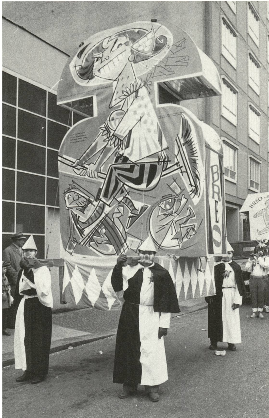
Abb. 82 Die Laterne der Breo Clique zeigt «e Parfimfläschli mit em Eau de Bâle» und behandelt das in Basel und Riehen angenommene sowie in Bettingen abgelehnte Frauenstimmrecht auf Gemeindeebene.