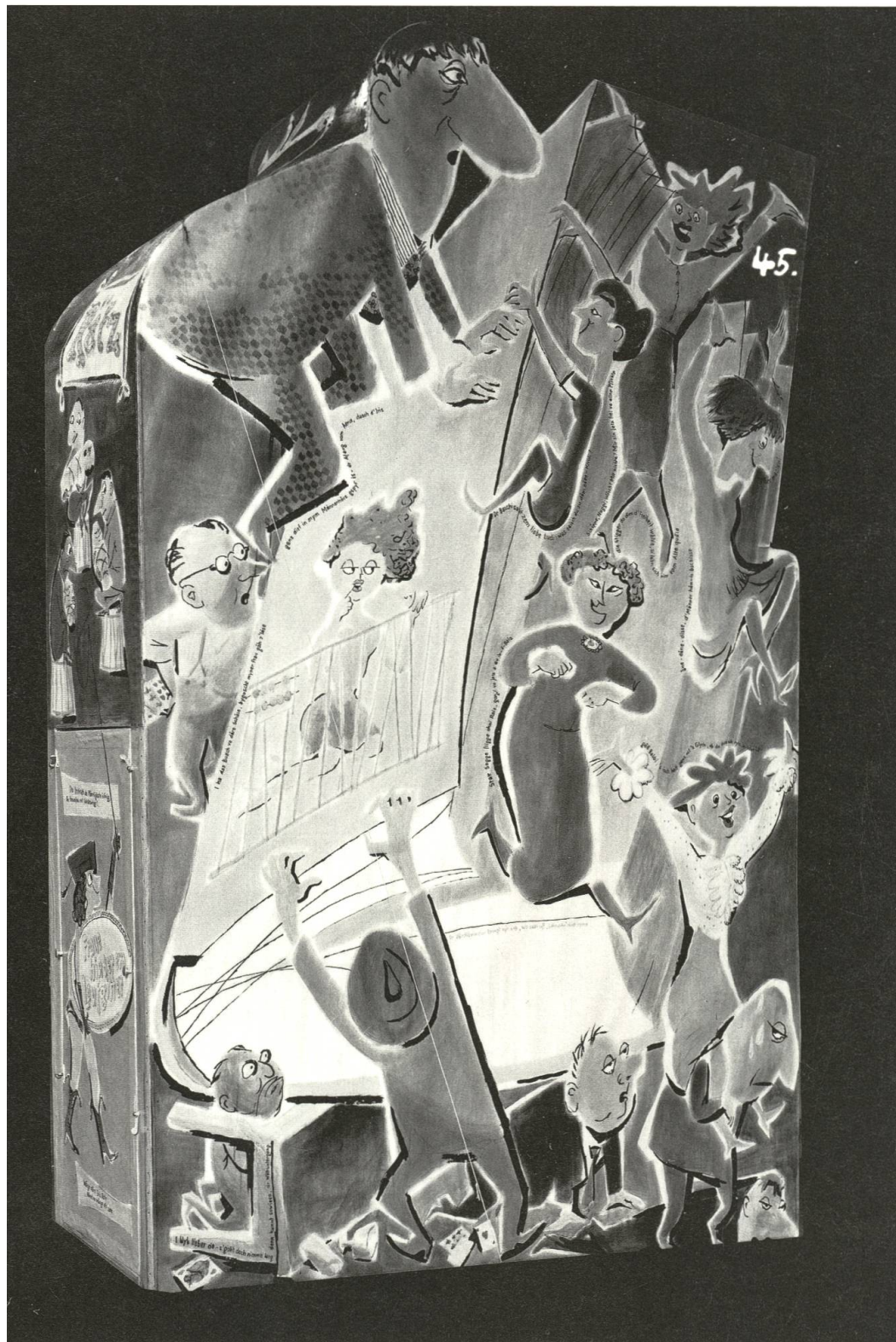
Abb. 83 Die Rätz-Clique spielt das Sujet «d'Fraue hinder em Gitter» aus.

Si isch nimme-n-uuschliesslig Muetter und Frau, was dr Ma ka, das ka si doch alles au, si isch e genialische Zwitter und geheerti nit hinder e Gitter. 14