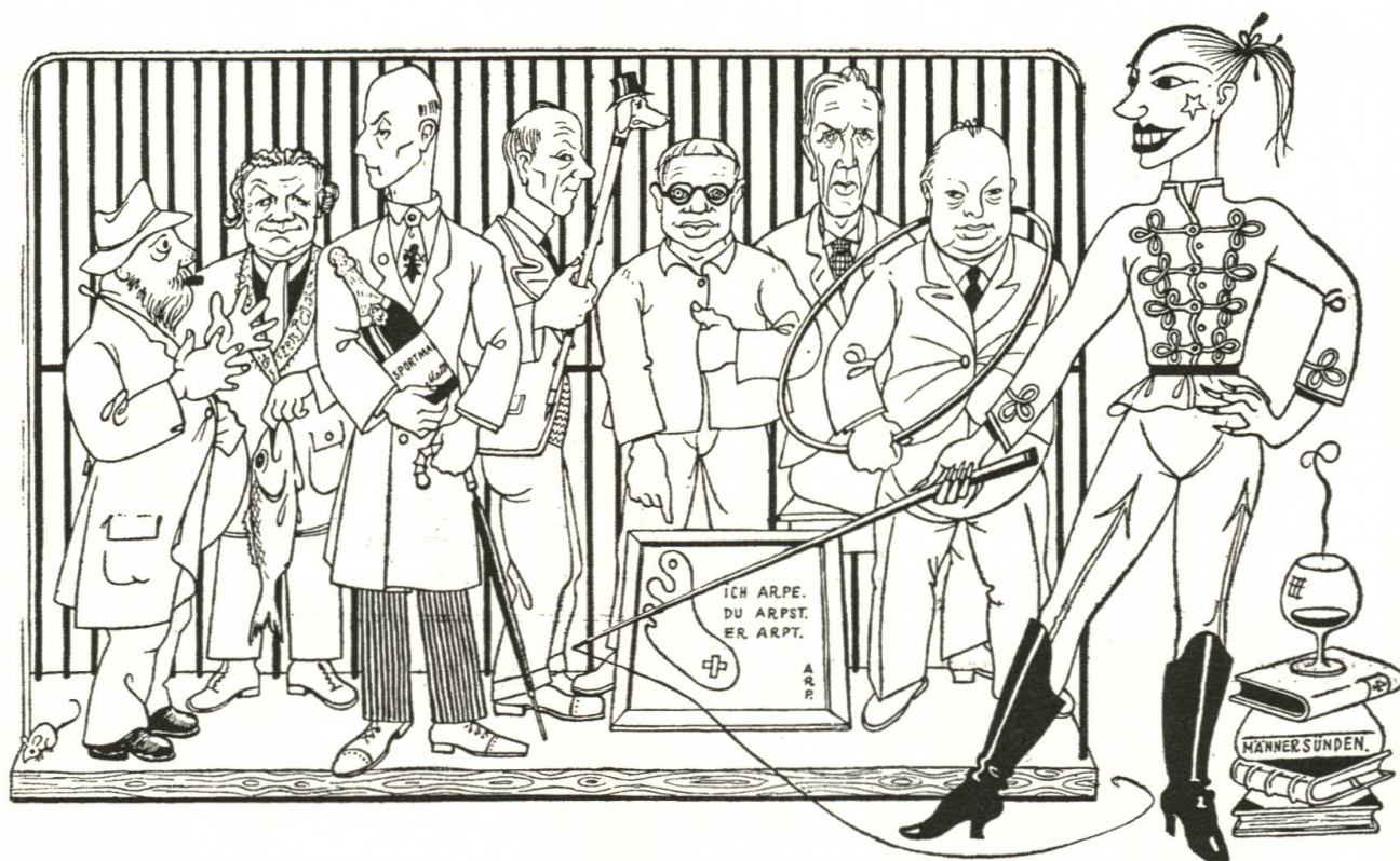
Abb. 78 Karikatur von Iris von Roten als Domina im «Suf-Ragetenblatt».

ds Männli uf Kommando und tanze nach mym Pfyfli. Der Augenschein ... trog nicht: kein Zweifel, sie hatte den schon in ihrem ersten Buche bestrittenen kleinen Unterschied zwischen Mann und Frau beseitigt und so geschickt operiert, dass sie als berufstätige Dompteuse die Gleichberechtigung behaupten konnte. Was heisst Dompteuse? Das wäre ja ein Fräuleinberuf: nein als Dompteur hatte sie alle Zeichen weiblichen Schamgefühls und Charmes gegen männliche Hormone und Privilegien vertauscht und schwang die Peitsche der Herrschsucht wie irgendein an der Managerkrankheit siechender Industriekapitän.» Auch der Kopf der Zeitung ist ganz auf dieses Thema bezogen: «Verlag: leicht irisierend. Redaktion: im Laufgitter zersplittert. Telephon: VerRothen, die, wo, Niederdorf. Und rechts und links ein Gedichtlein: «Oh Isis und oh's Iris,/Ach wüsstet ihr, wie mir is! / Ich lauf am Gitter her und hin, / Weiss nicht mehr, ob ich's selber bin!» und «Oh Iris und oh Isis, / Versteht doch, dass mir mies ist: / Ich las den Kohl von A bis Z. / Mir ist, als ob ich Durchfall hätt'.» Na ja, die Aggressionen, die Iris von Roten auslöste, sind offensichtlich so massiv, dass sich die irritierten Männer nicht scheuen, für ihre Kritik auf die Fäkalsprache zurückzugreifen.