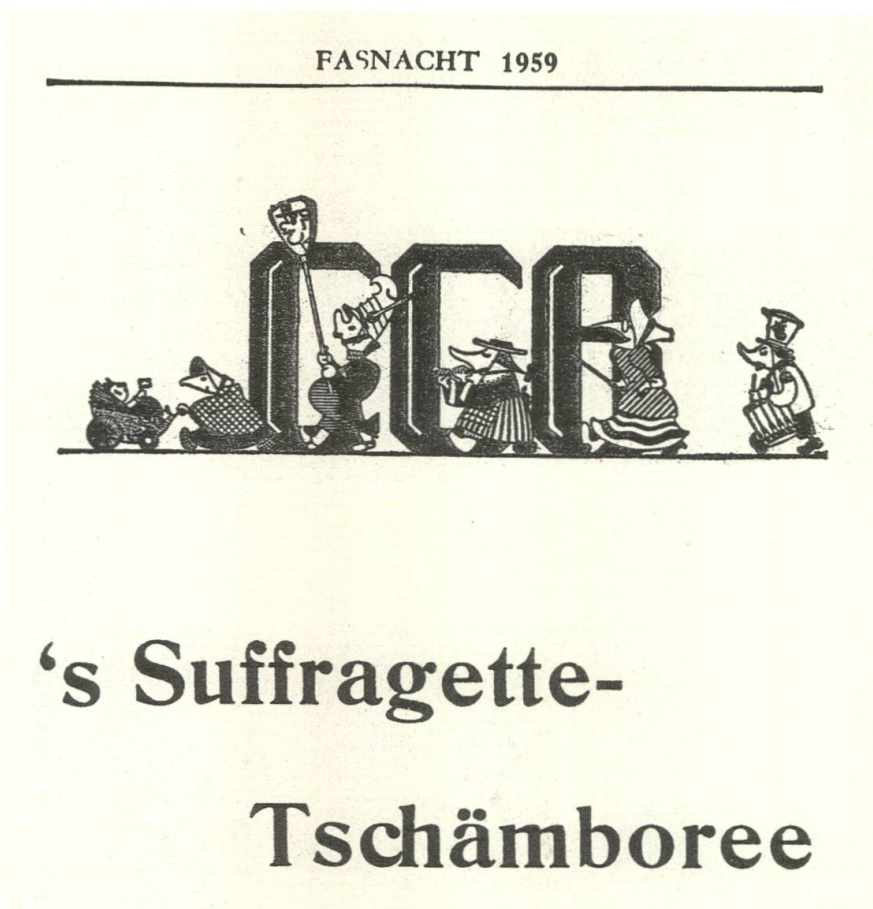
Abb. 86 Der Fasnachtszedel «s Suffragette-Tschäm- boree» des CCB.

Oh – glemmet ab – ihr SAFFA-Hiehner Mit sonnige Laufgitter-Späss Do z'Basel gehmer halt wie friehner Nur uf-em Petersplatz an d'Mäss! 16