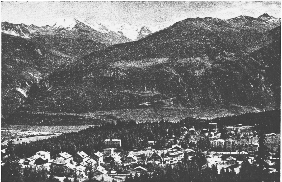
Blick auf Montana, auf das Rhonetal und ins Val d'Anniviers.

Die untersten Gehängepartien tragen alle Merkmale der Weinbaulandschaft: Reberge an den Halden, durchsetzt von kompakten Siedlungen. Varen, Salgesch, Miège