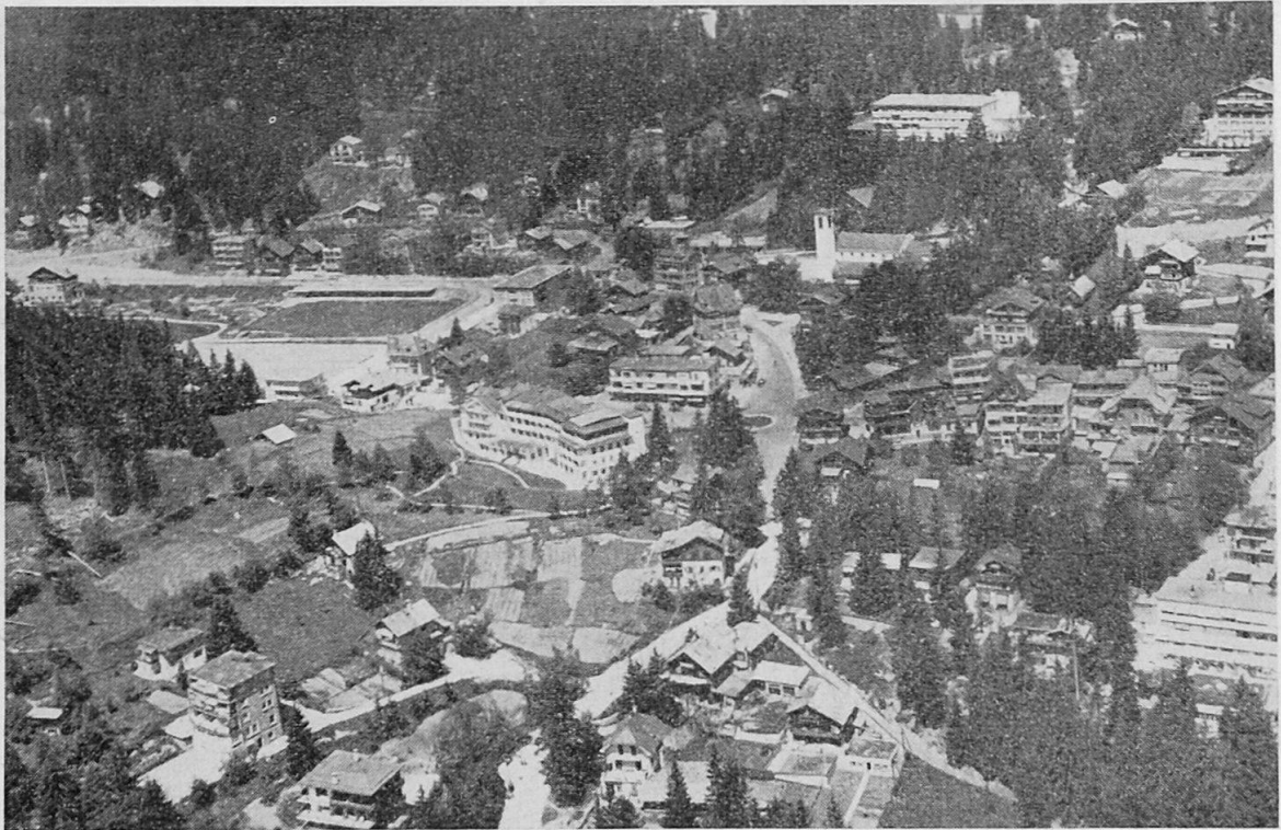
Montana mit seinen zahlreichen Hotels, Pensionen und Chalets.

Die einstigen Maiensäße sind im Bereich des Kurgebietes praktisch eliminiert, die Wiesen sind zu Golfplätzen geworden, Hütten teils abgetragen, teils zu Ferien-Chalets umgebaut. Das noch anfallende Heu wird in die Dörfer transportiert, der Verlust an agrarischer Nutzungsfläche ging parallel mit den wachsenden Beschäftigungsmöglichkeiten in den Kurbetrieben und in der Industrie des Tales. Freilich gibt es daneben noch etwas abseitige Gelände, die ihre alte Funktion als Maiensäße bewahrt haben; im gegen Westen exponierten Gehänge nördlich Iogne und in Plans Mayens nördlich Crans sind die privaten Wiesen und locker verstreuten Heuställe erhalten geblieben, ebenso in den Waldlichtungen nördlich Randogne und Mollens, aber überall leiden die Erträge unter dem Mangel an Wasser.