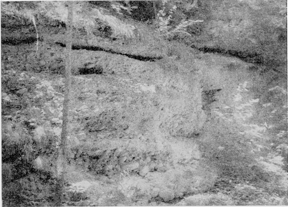
Abb. 3 Senkrechte Felswände gebildet aus verfestigten Schottern, am Wege Katzenlochbrücke-Diemtigen.

über das Gurtenstadium zu setzen sind. Da ich sowohl im Diemtigtal (GENGE, 1949), als auch im untern Simmental (GENGE, 1955) ein höheres Niveau, als das Gurtenstadium glaube gefunden zu haben, könnte man sich fragen, ob die verfestigten Kirelschotter nicht in das Interstadial Bantiger/Gurten zu setzen wären. Dem steht der Einwand gegenüber, daß die Schotter direkt auf anstehendem Felsen ruhen und soweit sichtbar, kein Moränenmaterial auf eine frühere Vergletscherung (Bantigerstadium) hinweist. Die Bezeichnung «Nachriß-Schotter» würde im weitesten Sinne auch ein solches Interstadial einschließen.