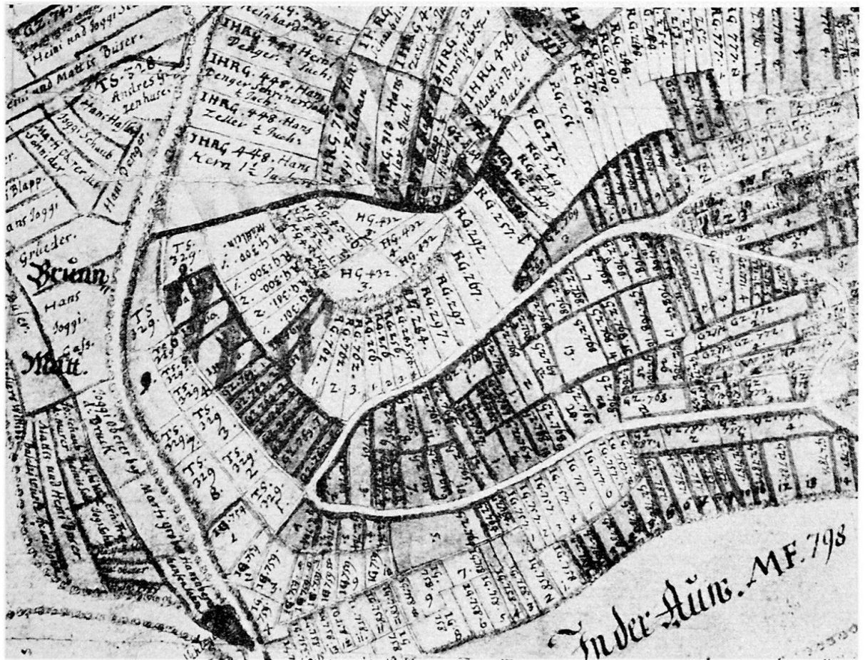
Fig. 1 Ausschnitt «Rebberg» aus dem Zehntenplan Sissach von G. F. Meyer

resse hieran galt der besseren steuerlichen Erfassung der Urproduktion zur Erhebung der Zehnten. Der Sissacher Zehntenplan besteht aus 2 Hälften «Carten A und B». Deren Titel lauten: «Grundriß des Dorfes Sissach und dessen Zehntguettern welch im Sissach Bann diesseits der Ergolz gelegen, Carten A». Scala von 70 Basel Ruthen (1:2750, 119 x 73 cm südorientiert) und «Grundriß des Dorfes Sissach sammt dessen Zehntguettern, welche im Sissach Bann jenseits der Ergolz gelegen, Carten B». (Scala 110 Basel Ruthen, 1:2860, 119 x 73 cm nordorientiert).