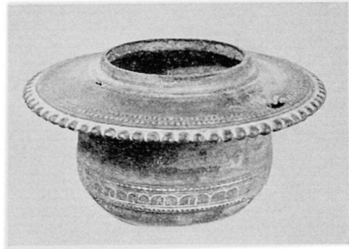
Fig. 1 (links): Hohles Tonggefäß in Form eines gemästeten Hundes, rotbraun und schwarz bemalt, eine Schale auf dem Kopf tragend. Länge: 38 cm. Colima (Mexico) Katalognummer 12267. — Fig. 2 (rechts): Hindu-javanisches Weihwassergefäß aus Bronze. Durchmesser: Gefäß 12 cm, mit Rand 18 cm, Höhe 9 cm. Katalognummer 12221.

sehstudio in Zürich 34 Objekte für eine Sendung von René Gardi zur Verfügung. Die Gesamtbesucherzahl betrug 2841 Personen, darunter 22 Schulen (meistens für den Zeichenunterricht) und 4 Vereine. Der Unterzeichnete und Frl. Dr. Leuzinger führten verschiedentlich an Hand von Demonstrationen Führungen durch. Im Juni 1958 wurden die Japan- und China-Abteilung für einige Tage an Frau Nakamura für die Abhaltung eines Kurses über das japanische Ikebana (Kunst des Blumenbindens) und Vorführung des «Blumenarrangements» zur Verfügung gestellt.