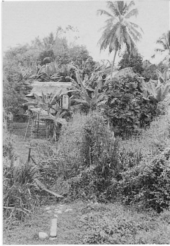
Abb. 5 «Brücke» über ein Urwaldflüßchen in Honduras. Abb. 6 Indianischer Pfahlbau im Wald der regenreichen atlantischen Küste Nicaraguas.