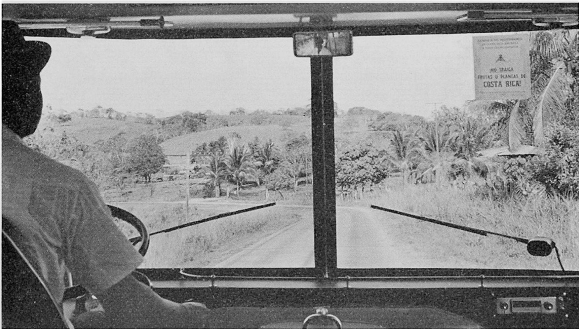
Abb. 7 Am Panamerican Highway in der Plantagenlandschaft Costa Ricas. Die Autobahn gleicht hier eher einer Landstraße.