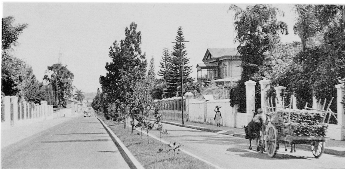
Abb. 3 Vorstadt von Guatemala. In diesen teilweise neuen Quartieren wird der Panamerican Highway, schon vor 25 Jahren fertiggestellt, fast ebenso häufig von Ochsenkarren wie von Autos benützt.