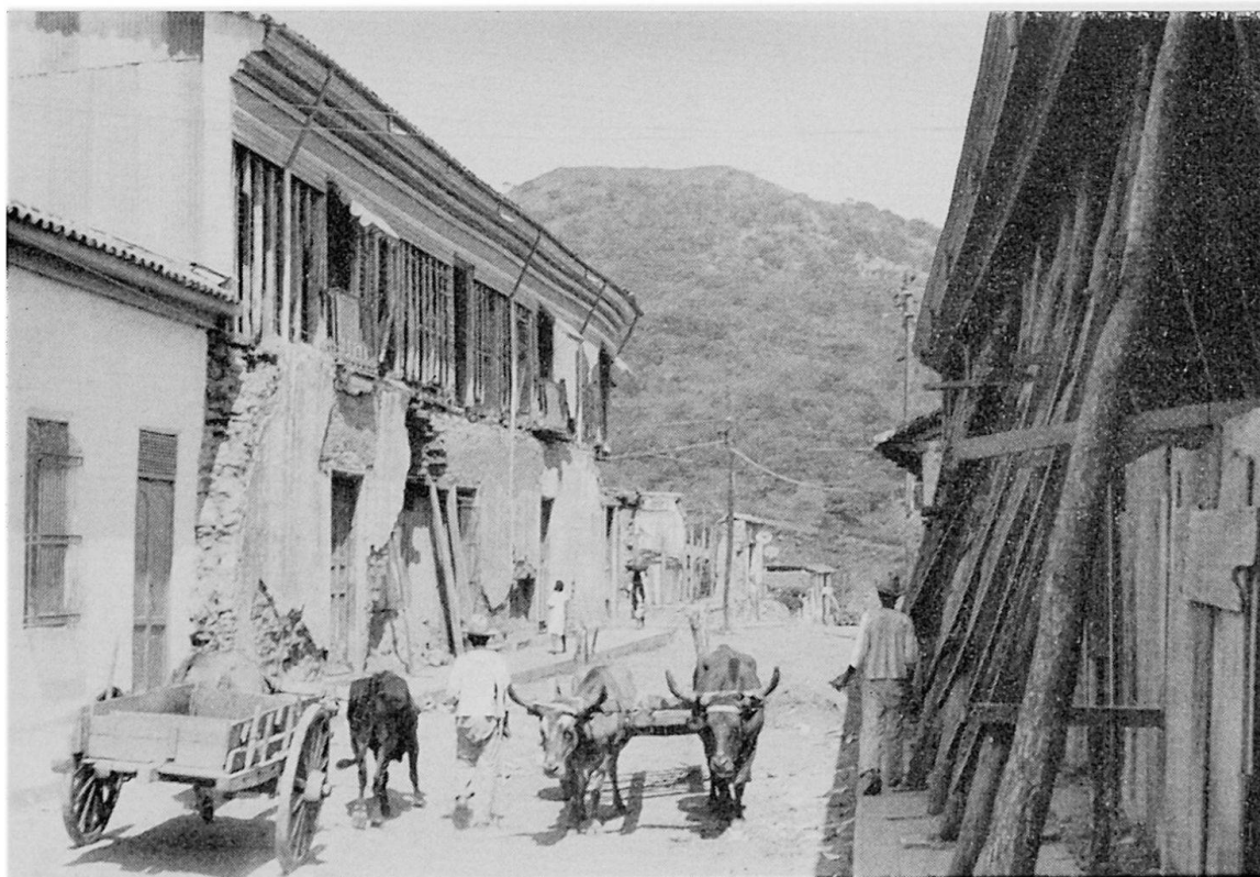
Abb. 4 Straße in San Miguel, El Salvador. Die Straße läßt deutlich Spuren eines Erdbebens erkennen, nach welchem die Bauten nur notdürftig geflickt wurden.