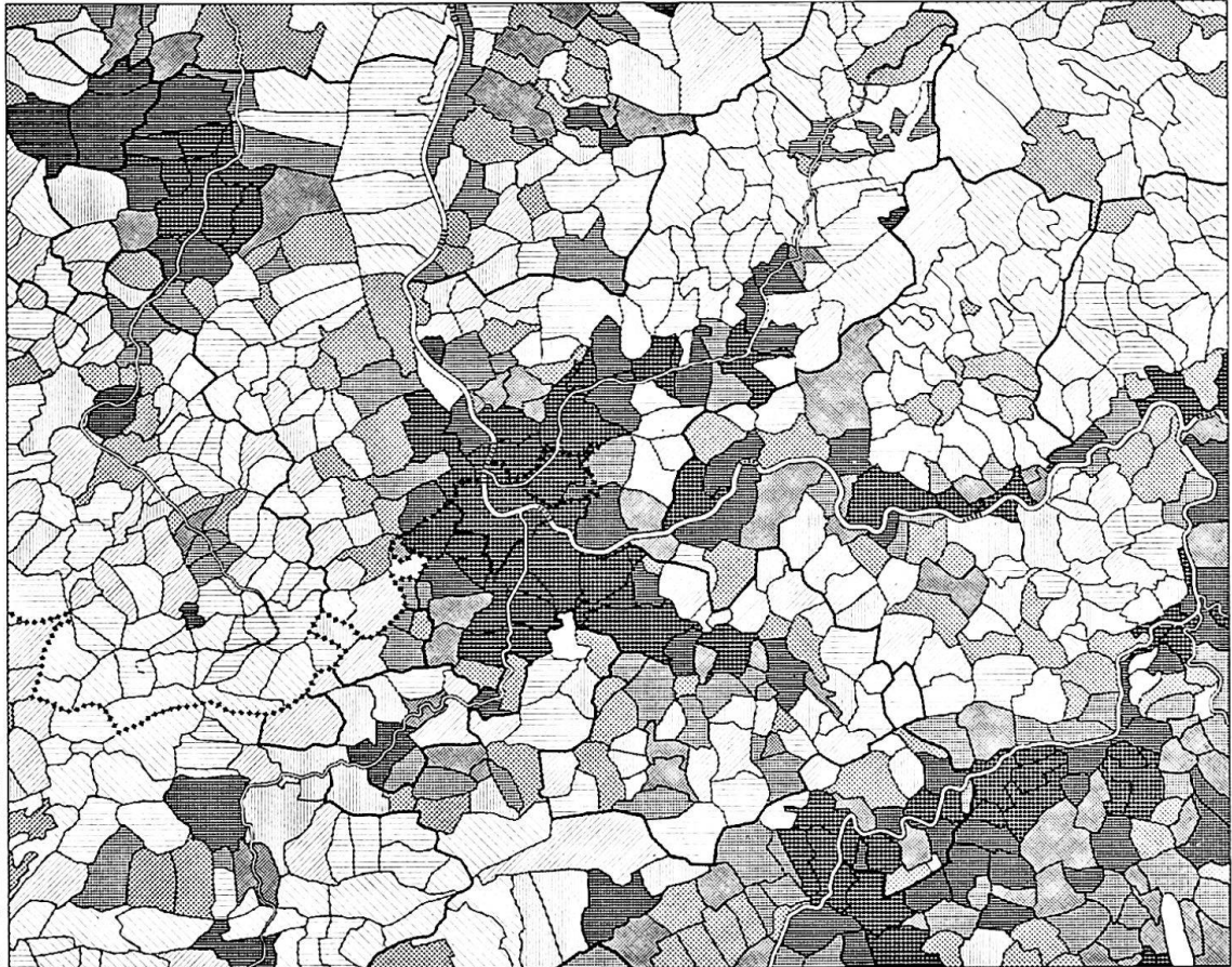
Strukturatlas Nordwestschweiz, Oberelsaß, Südschwarzwald Atlas du Nordouest de la Suisse, Sud de l'Alsace, Sud de la Forêt Noire