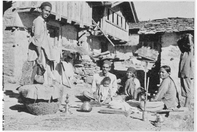
Abbildung 2. Bajgi-Familie: zwei Brüder mit Kind, Mutter und gemeinsamer Gattin (Polyandrie)

1. Die Einschulung der Kinder: In der Zeit zwi- schen 1947 und 1950 hatten die Distriktsbehörden die Zahl der Dorfschulen von 21 auf 94 erhöht. Es zeigte sich aber bald, daß die Kolta-Kinder den Schulen fernblieben: die hohen Kasten sahen für sich keinen Nutzen in der Ausbildung dieser Kin- der, und die Kolta hielten sich für zu gering, um den hohen Kasten die Stirn zu bieten. Fortschrittliche Lehrer und Sozialarbeiter kämpften indessen gegen die Widerstände. So durfte denn auch in Dasau schließlich einer von den drei im richtigen Alter ste- henden Kolta-Knaben in die Schule eintreten. Seine Familie hoffte, er werde eines Tages Beamter im Tiefeland. Der Vater, von einem gewissen Ehrgeiz gepackt, stellte ihn mir bezeichnenderweise mit dem eigentlich den Rajput vorbehaltenen Nachnamen Singh vor.