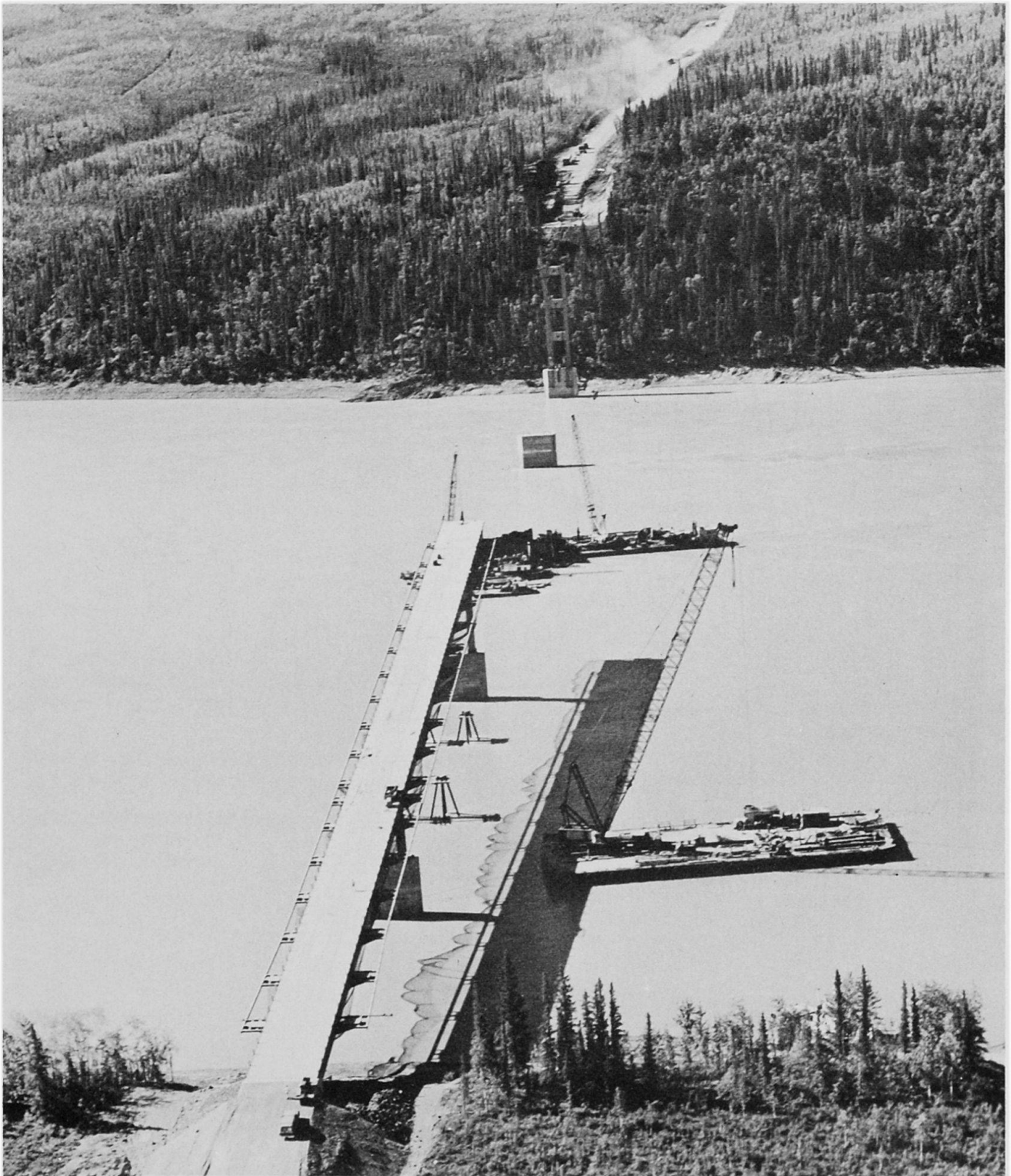
Abb: 2: Staat und Alyeska Pipeline Service Company teilten sich in die Kosten dieser 1975 fertiggestellten Brücke über den Yukon River, welche einmal auch die Pipeline tragen wird. Wir blicken in südlicher Richtung in noch unbesiedelte Waldgebiete. Bisher existierten nur temporäre Brücken im Gebiete des Yukon River.