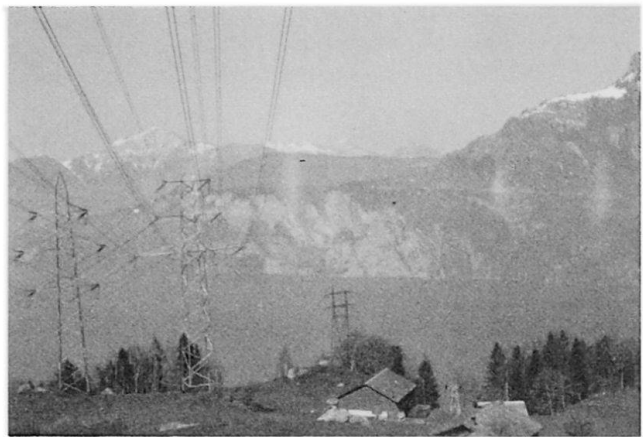
Abb. 4 Leitungsmasten stören die Landschaft auf Unter-Axen am Urnersee; im Mittelgrund Felsflühe des Seelisberg.

lich die Erstellung dieses geologischen Gutachtens abgelehnt und beschlossen, den Problembereich der Materialentnahme auf kantonaler Ebene zu regeln. Immerhin konnte das Eidg. Oberforstinspektorat bei Rodungsgesuchen zur Erweiterung von Steinbrüchen landschaftspflegerische Auflagen machen. So wurde im Rotloch, dem größten Steinbruch der Region, mit der Erteilung der Rodungsbewilligung ein Rekul-