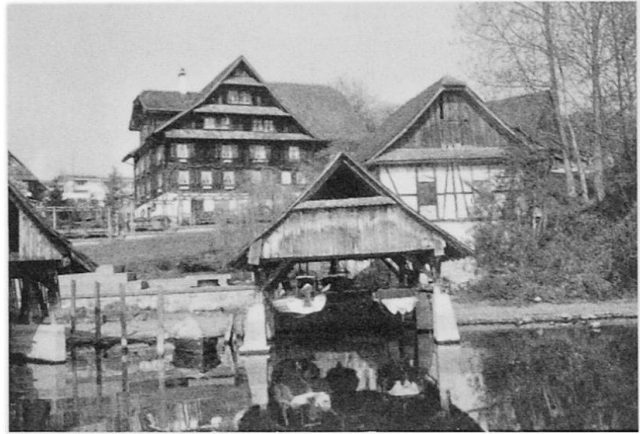
Abb. 2 Das «Fischerdörfchen» Angelfluh bei Vorder-Meggen, ein schützenswertes Ortsbild.

Am Vierwaldstättersee bilden die zahlreichen Steinbrüche empfindliche Eingriffe ins Landschaftsbild. Sie wurden als Landschaftsschäden inventarisiert. Auf Veranlassung des Eidg. Oberforstinspektorates hätte eine Detail-Inventarisierung der Steinbrüche die Grundlage der künftigen Abbauplanung bilden sollen. Dabei hätte man versucht, weniger exponierte Abbauvorkommen zu erschließen, um die seeseitigen Steinbrüche nach Möglichkeit aufzugeben und zu rekultivieren. Aus politischen und finanziellen Gründen haben die Innerschweizer Kantone mehrheit-