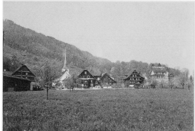
Abb. 3 Das schützenswerte Ortsbild von Greppen am Küßnachersee.