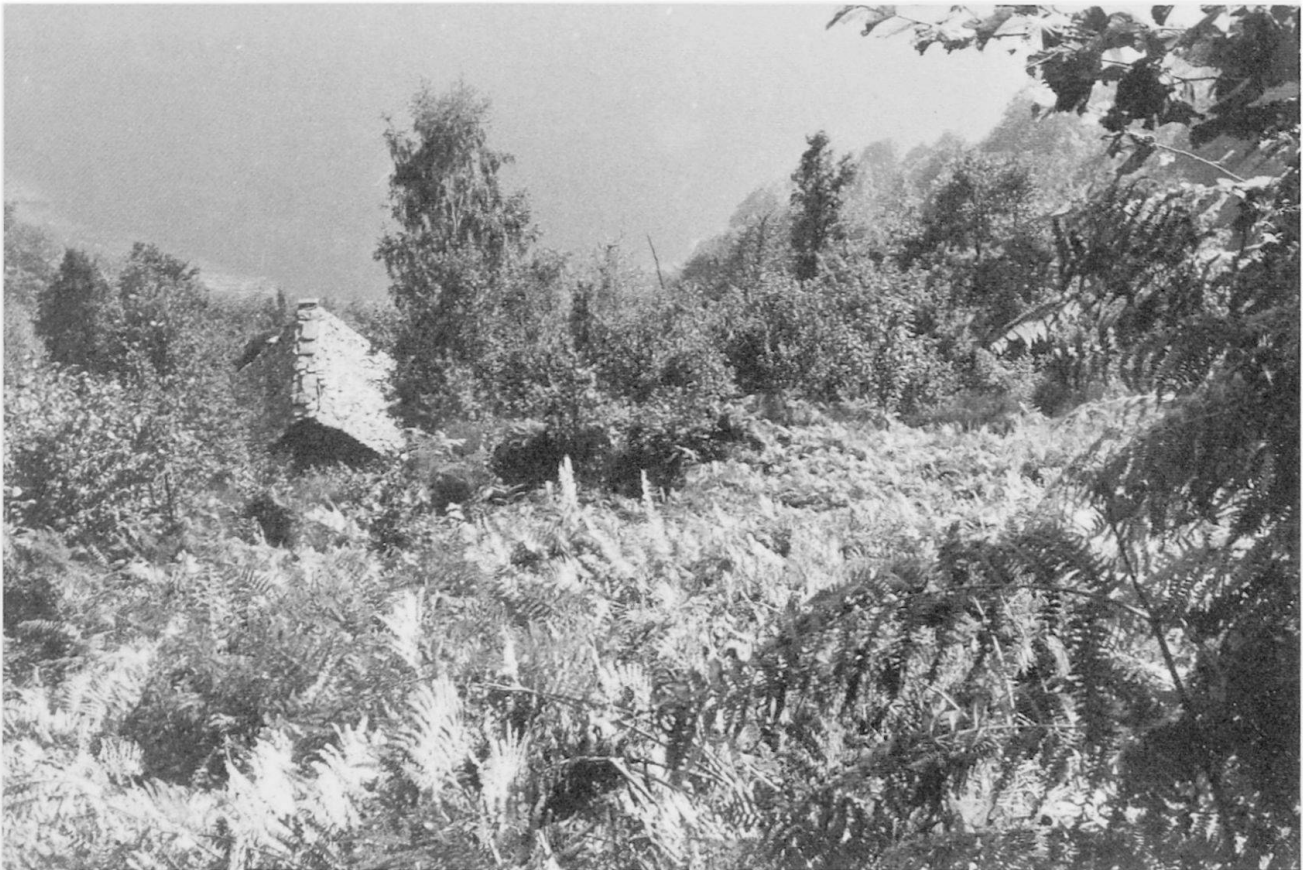
Bild 1 Ausgedehnte Flächen von pteridium aquilinum (Adlerfarn) in Dugn (707 750/125 000) (September 1978).

Jahrhunderts dienten noch alle Siedlungen der Landwirtschaft. Heute werden nur noch einige größere, gut begehbare Häusergruppen von Einheimischen in Stand gehalten. Die übrigen Siedlungen, vor allem die kleinen, zerfallen.