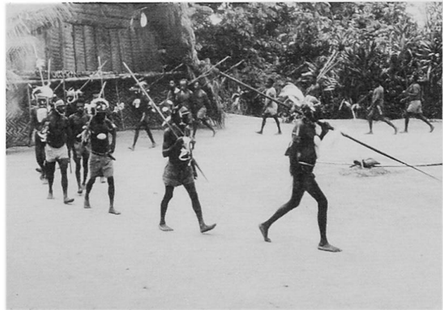
Abb. 2 Kultplatz in Mamsi (Bongos-Gebiet, Kwanga); Jäger tanzen um ein getötetes Tier (Wallaby), links im Hintergrund die Fassade des Kulthauses.

Zeremonien wieder verfällt. Auch andere Objekte, die mit dem Kult zusammenhängen, werden nicht für eine Dauer, als permanente äußere Erscheinung einer jenseitigen Wesenheit, angelegt. Das ist der Grund, warum man in Kwanga-Dörfern meistens keine kwaramba -Kulthäuser antrifft. Der Tanzplatz ( kondome ) wird während des Kultes zeitweise durch einen zusätzlichen Zaun abgegrenzt. Vor den Festen wird sämtliches Gras auf dem Platz entfernt. Die Sitzplätze für die Männer befinden sich auf den Seiten des Platzes.