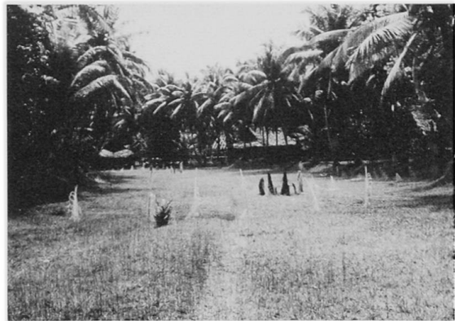
Abb.1 Tanz- und Kultplatz Kosimbi von Gaikorobi (Sawos), mit Kultsteinen und weißen Palmblättern in der Mitte; links im Hintergrund das Männerhaus, auf den seitlichen Längshügeln Kokospalmen.

Der Dorfgrundriß wird bei den Sawos, deren Dörfer nicht wie diejenigen der Iatmul auf Uferdämmen des Sepiks oder an Altwasser liegen und daher von der Topographie mitbestimmt werden, durch die langgestreckten Tanzplätze beherrscht. An den Seiten dieser Plätze ziehen sich die Längshügel hin, die meistens von Kokospalmen und Ziersträuchern bewachsen sind. An den Schmalseiten der Plätze stehen die Männerhäuser.