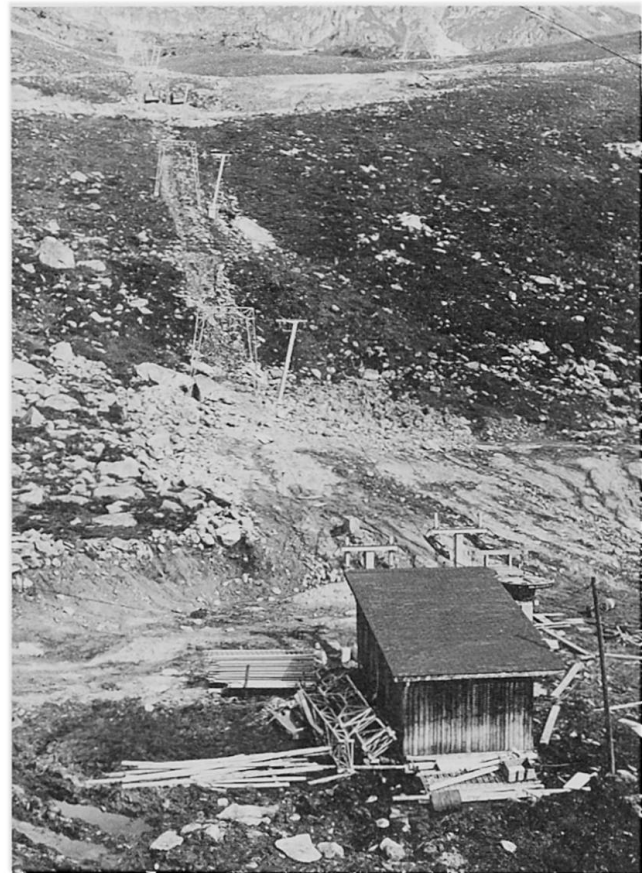
Abb. 1 Geländeplanierungen in der Umgebung einer Skiliftstation

Geländeplanierungen im Zusammenhang mit den Skiabfahrtspisten gehören heute zum gewohnten Bild einer touristischen Station (Abb. 1). Das Spektrum der